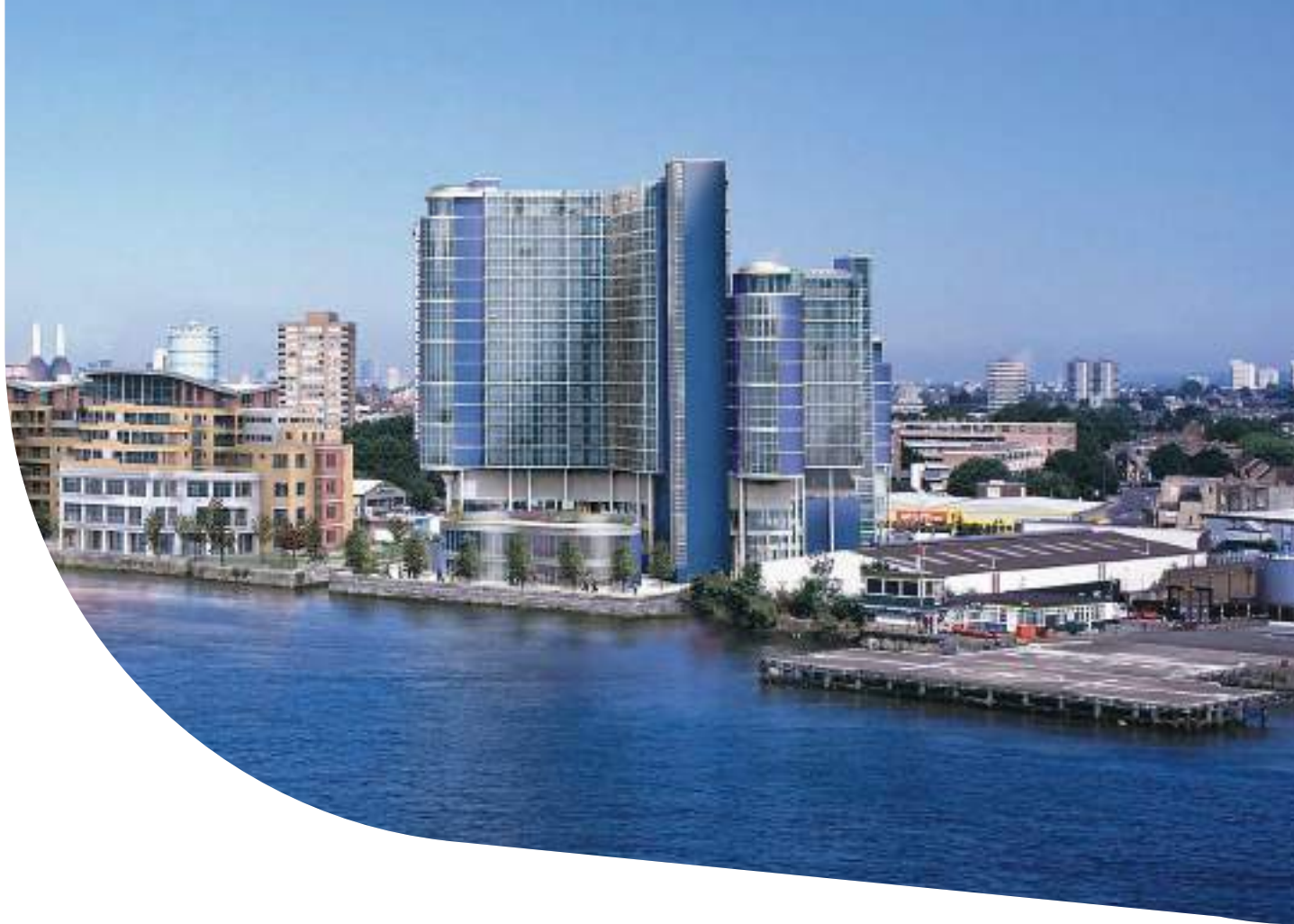
Pilkington OptiView™ , Falcon Wharf, Londra.